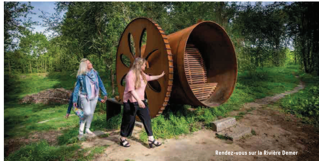
Rendez-vous sur la Rivière Demer