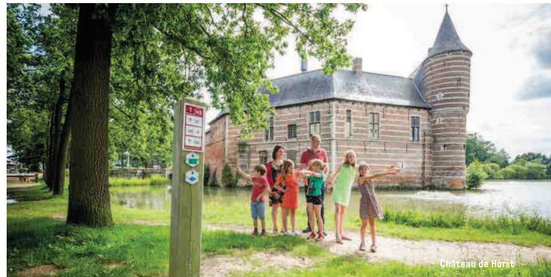
Château de Horst