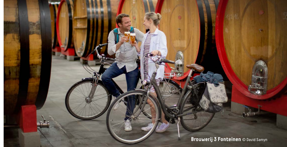
Brouwerij 3 Fonteinen