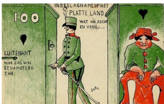
De opeisingen worden gehekeld.

Een stappenplan om bestaande spotprenten en cartoons te ontleden is te vinden in de inspiratiegids 'Klein in de Grootte Oorlog', p. 60-61. Zie www.vlaamsbrabant14-18.be > publicaties > educatief aanbod voor de leerkracht.