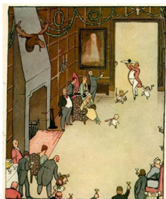
Het laatste steenkooltje wordt plechtig binnengedragen.