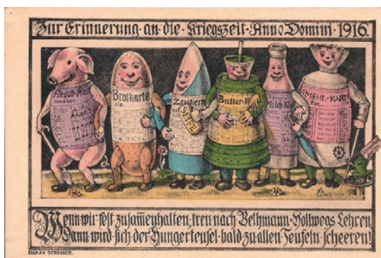
De voedselbonnen ludiek voorgesteld.