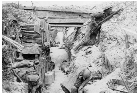
Loopgraaf in de Eerste Wereldoorlog

Loopgraven: uitgegraven gang waarin de soldaten rechtop konden staan zonder geraakt te worden door vijandelijke kogels.