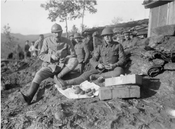
Franse en Britse troepen maken handgranaten onklaar.

Granaat: grote kogel, die springstof bevat. Kleinere granaten worden met de hand gegooid, grotere met een soort kanon.